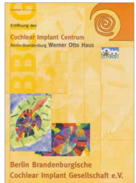
Sonderausgabe zur Eröffnung des CIC in 6.2000, DIN A4