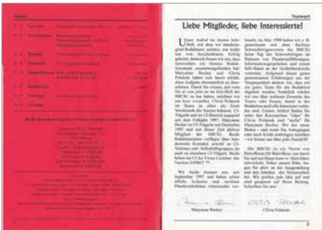
Heft Nr. 2, 5.1999