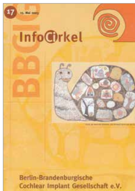
InfoCirkel, Heft 17, 15.5.2003