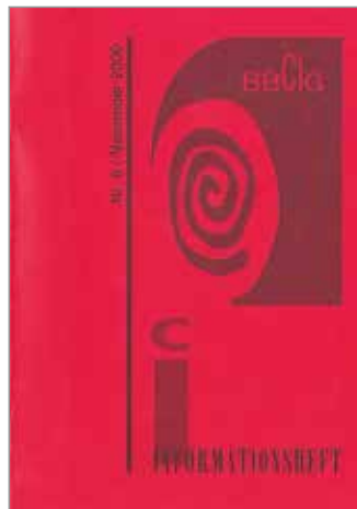
Nr. 8, 11.2000, letzte Ausgabe in DIN A5